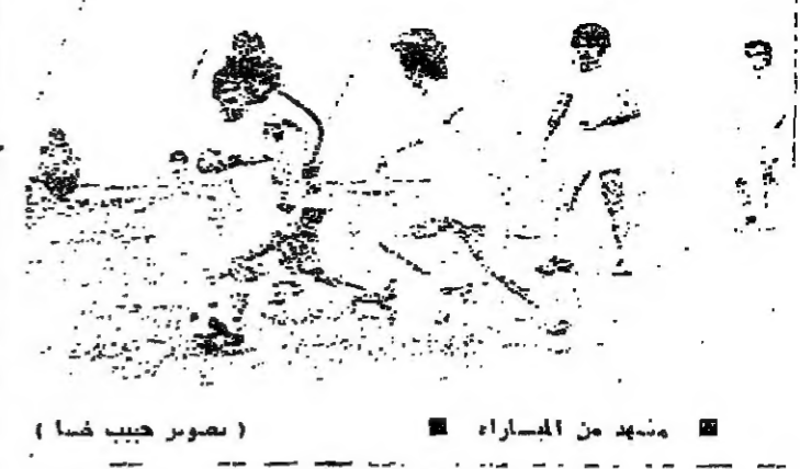
مشهد من المباراة